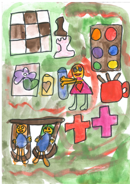
En KKFO er et sted, hvor man næsten kan gøre alt . Rosa 0.a